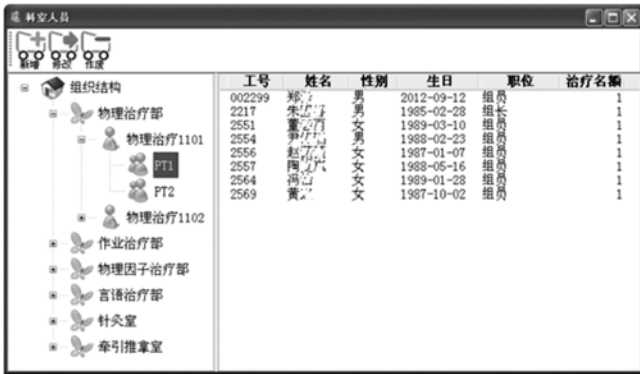
图3 康复治疗中心人员管理系统

2.2 工作负荷查询 通过系统可以查询到各个治疗师的工作负荷、以及统计康复设备当前的使用率,从而更有效地为患者安排时间段。