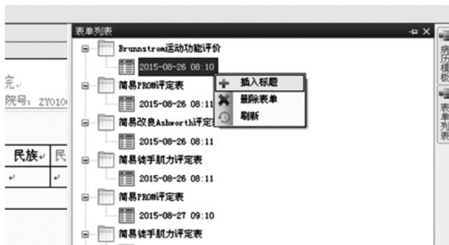
图4 康复治疗电子病历

2.3 康复治疗电子病历 由于目前国内没有统一的康复治疗电子记录模板,根据我院实际情况,由本院治疗师和软件工程师合作研发了康复治疗师电子病历系统。该系统为康复治疗管理系统的模块之一,与医生电子病历系统联网,可调阅患者的病历资料;同时邀请康复治疗专家论证,制作适用于我院的康复治疗记录模板,将常用的康复评定表维护到系统中,为了操作方便,将每一项评定内容制作成选项形式,治疗师通过点击选项,评定结束自动生成分值与结果,通过累积建立了评定数据库,既提高了工作效率也为科研工作地开展提供了客观的数据。详见图4。